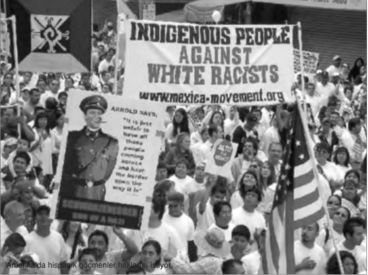
Amerika'da hispanik göçmenler haklarını istiyor

hoşnutsuzların kitlesel savaşının patlak vermesinden başka türlü olamaz. Küçük burjuva kesimler ve geri işçiler kaçınılmaz olarak ona katılacaktır –böyle bir katılım olmadan bir kitle mücadelesi, genelde hiçbir devrim mümkün değildir– ve yine kaçınılmaz olarak harekete önyargılarını, gerici hayallerini, hata ve zaafalarını taşıyacaklardır. Fakat nesnel olarak bunlar sermayeye saldıracak, ve devrimin sınıf bilinçli öncüsü; kitle mücadelesinin çeşitliliği, uyumsuzluğu, renkliliği ve görünüşte parçalanmışlığı nesnel gerçeğini ifade eden ileri proletarya, bu hareketi koordine etmeyi ve yönlendirmeyi, iktidarı ele geçirmeyi, bankalara el koymayı, herkesin (değişik nedenlerle de olsa!) nefret ettiği tröstleri mülksüzleştirmeyi bilecek ve bir bütün olarak burjuvazinin yıkılmasına ve sosyalizmin zaferine, küçük-burjuva yumuşakçalarının bir vuruşuyla ‘yerine getirme’nin mümkün olmadığı bir zafere yol açacak başka diktatöryal önlemler uygulayacaktır.” (Age.S.342)