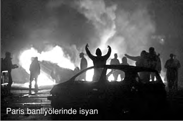
Paris banliyölerinde isyan

den beri var olagelmişti. Bu sözcük, tabii ki, Marksist Leninist komünistlerce üretilmiş de değil. Fakat daha kuruluşundan itibaren “ezilenler” kavramının komünist öncünün varlığında önemli bir yer tuttuğunun altını çizebiliriz. Ancak “Ezilenlerin Sosyalist Platformu”nun ilanı ve o bayrak altında Marksist Leninist komünistlerin geliştirdiği politik mücadele tarzı, “ezilenler” sözcüğüne ilerici devrimci hareket içerisinde bugünkü özgün politik kavramsal değerini kazandırmıştır. “Ezilenler” sözcüğünün böylesine etkin bir kavramsal değer kazanmasının bir temel nedeni de değişik toplumsal kesimlerin bu kavramda kendi gerçeklerini, sorun ve taleplerini bulabilmeleri, bu kavramla belli bir özdeşlik ilişkisine kolaylıkla girebilmeleridir. Belki de Marksist Leninist komünistlerin üstünlüğü ilkin, bu noktada tarihin dilini çözmeyi başarmış olmaları, akabinde ise, geliştirdikleri mücadele tarzı ile tarihin öncüden istemlerini yanıtlayabilme yeteneğini göstererek bütüncü bir ilişkilenişi kurabilmiş olmalarındadır.