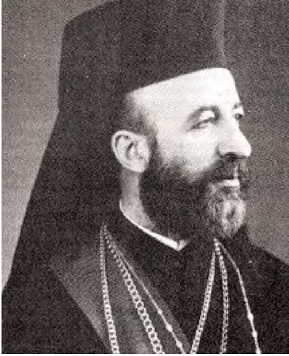
Eski Kıbrıs Cumhurbaşkanı Makarios

sında AB üyeliğine ilişkin protokol imzalanacak. 2004 yılının başında da tam üyelik gerçekleşecek. Bu durumda Türk devleti, bir AB ülkesini tanımamış ve dahası, bir AB ülkesinde işgalci bir güç haline gelmiş olacak. Türk burjuva devleti 29 yıldır sürdürdüğü işgali sürdürme niyetinde. Türk egemen sınıflarının bu cesareti ABD'den aldığı açık.